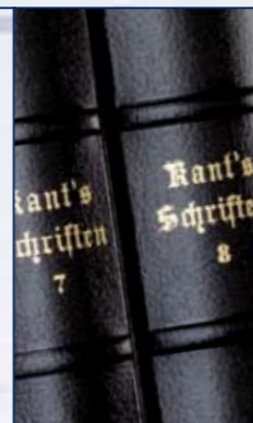
Kant's gesammelte Schriften Reprint der Originalausgaben von 1910

Verlag Walter de Gruyter, Berlin 11 Bände, 3.852 Seiten, Format 14,3 x 22,2 cm Inhalt gedruckt auf Werkdruckpapier 80 g säurefrei, alterungsbeständig Bezugsmaterialien Regentleinen 377 und Cabra Tumble schwarz Goldprägung und Bünde auf dem Rücken www.degruyter.de