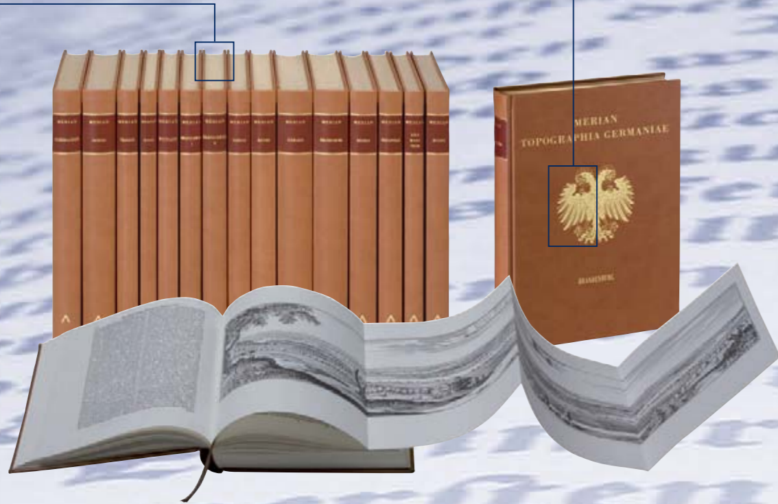
Merian Topographia Germaniae Reprint der Originalausgaben von 1656

Archiv Verlag, Braunschweig 15 Bände, 3.776 Seiten, Format 18,5 x 26 cm Inhalt gedruckt auf Werkdruckpapier 100 g säurefrei, alterungsbeständig Bezugsmaterial Winner 028 mit zweifarbigem Prägung Insgesamt 26 Falltafeln, Leseband, Kopfgoldschnitt www.archiv-verlag.de