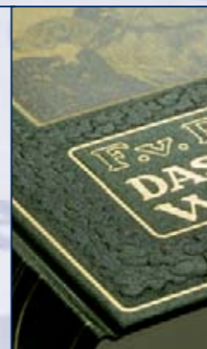
Ferdinand von Raesfeld; Das deutsche Weidwerk Reprint der Originalausgabe von 1914

Paul Parey Zeitschriftenverlag, Singhofen 688 Seiten, Format 17,5 x 24,5 cm Inhalt gedruckt auf Werkdruckpapier 90 g säurefrei, alterungsbeständig Bezugsmaterial Englisch Arbelave Buckram - RAL rg557, zweifarbigem Siebdruck sowie aufwendige Prägung (Blind/Schwarz/Gold) Bedruckter Vorsatz; 12 mehrfarbige Tafeln 4c und Duplex www.paulparey.de